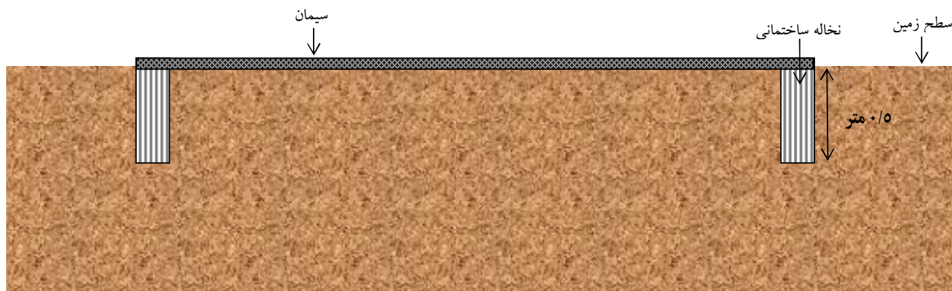
شکل (۲): برش عرضی زیرسازی ساختمان شماره ۲