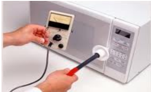
شکل (۱): روش اندازه‌گیری امواج میکروویو در نقاط مختلف اطراف فرهای میکروویو خانگی

برای یک نمونه فر در شکل (۲) نشان داده شده است. پاسخ فرکانسی دستگاه اندازه‌گیری مورد استفاده، در ناحیه فرکانس کار فرهای میکروویو قرار دارد.